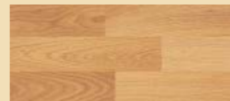
Beech D 1424