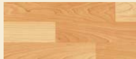
Maple D 1465