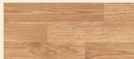
Oak Strips D 1418